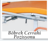
Böbrek Cerrahi Pozisyonu