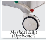
Merkezi Kilit (Opsiyonel)