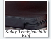
Kolay Temizlenebilir Kılıf