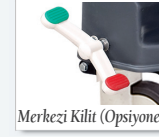
Merkezi Kilit (Opsiyonel)