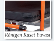
Röntgen Kaset Yuvası