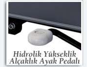
Hidrolik Yükseklik Açalıklık Ayak Pedalı