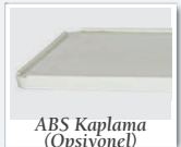
ABS Kaplama (Opsiyonel)