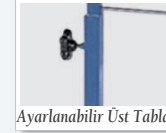
Ayarlanabilir Üst Tabla