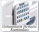
Dokümatik Hemşire Kumandası